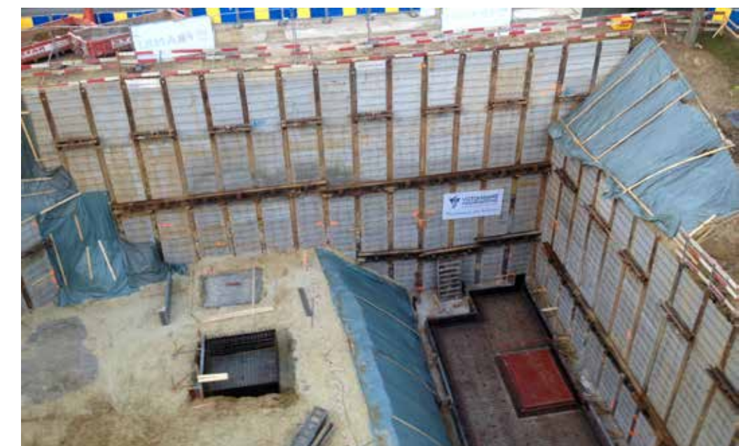
Votquenne Foundations breidt haar service zowel in de diepte als in de breedte uit.